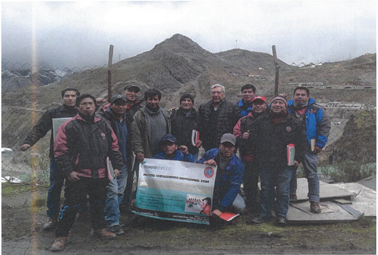
Foto 5: Agremiados del Sindicato Raura, luego del curso de Capacitación en Negociación Colectiva en el Centro Minero