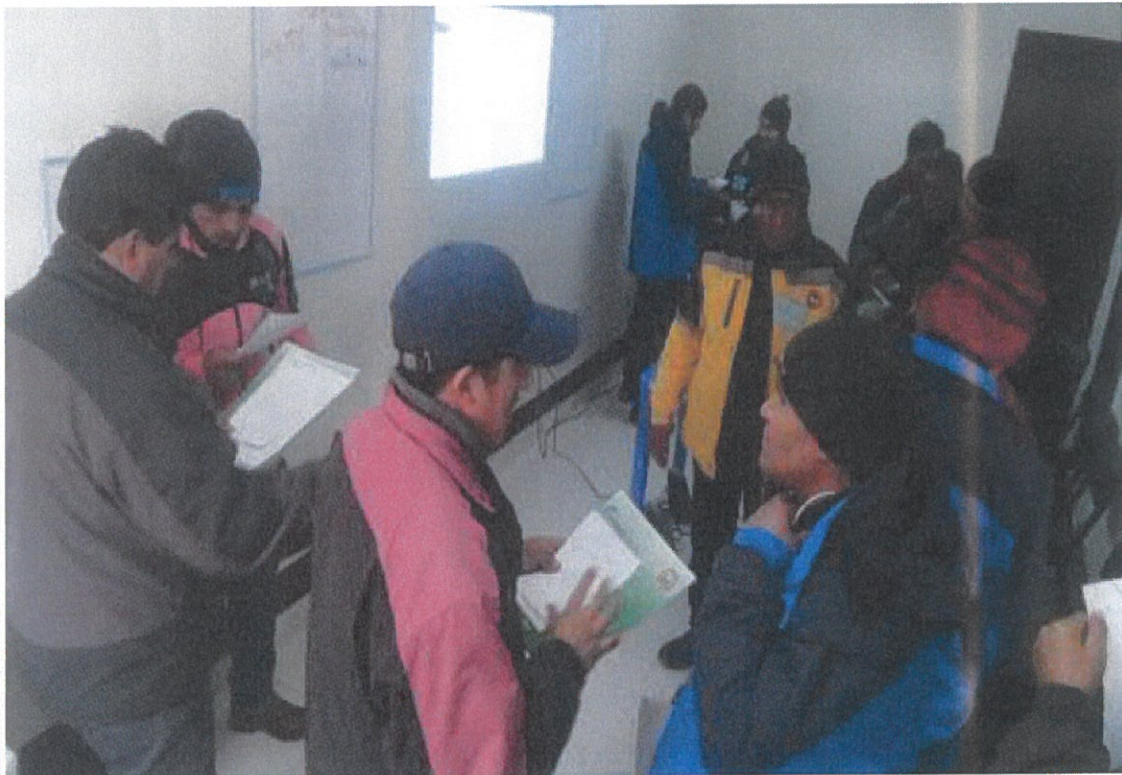
Foto 8: Prácticas y dinámicas como parte del curso de Habilidades Blandas y Dirigenciales