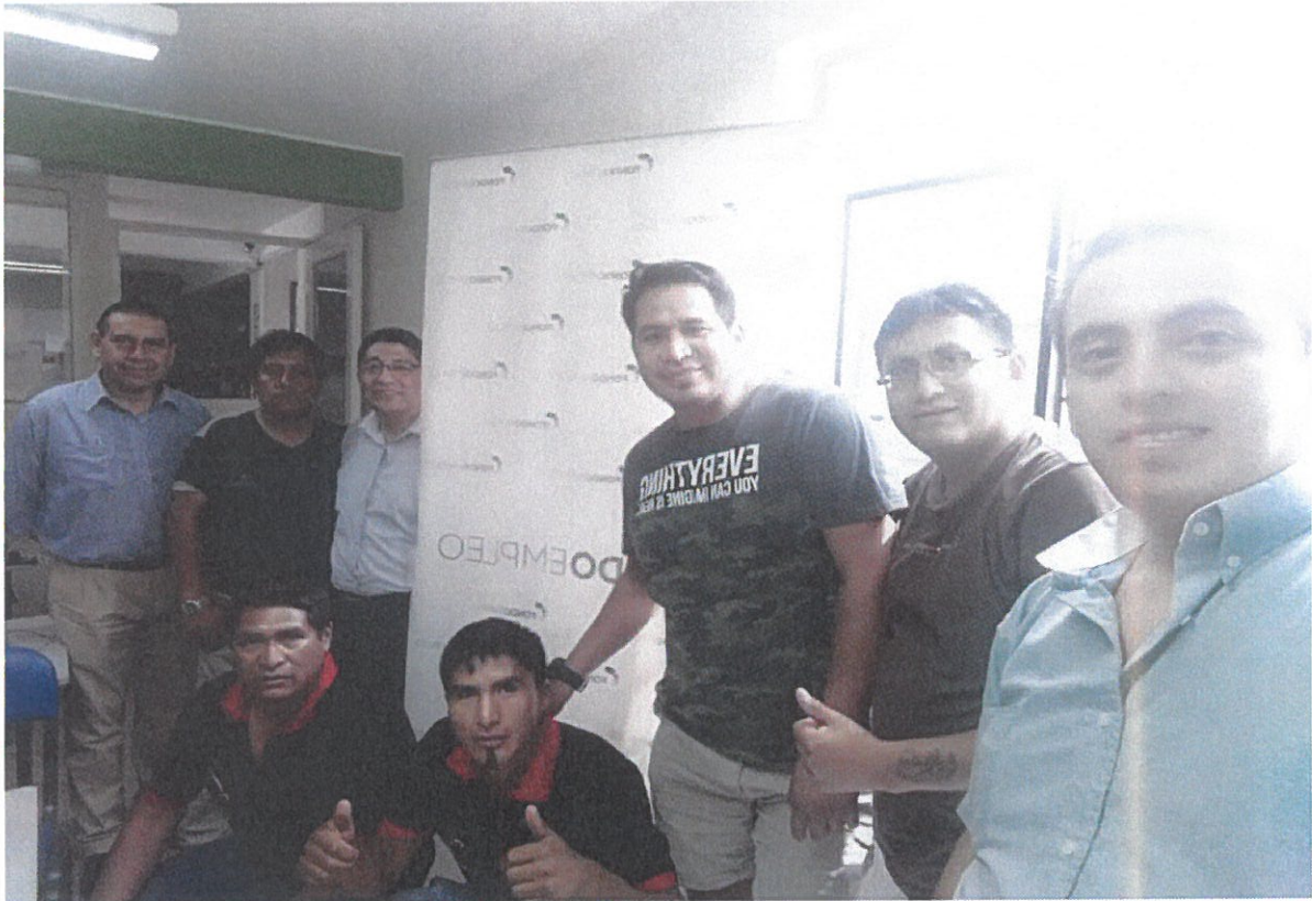
Fotos 3: Visita de supervisión al Curso de Capacitación Word y Excel utilizando Ratios Financieros.