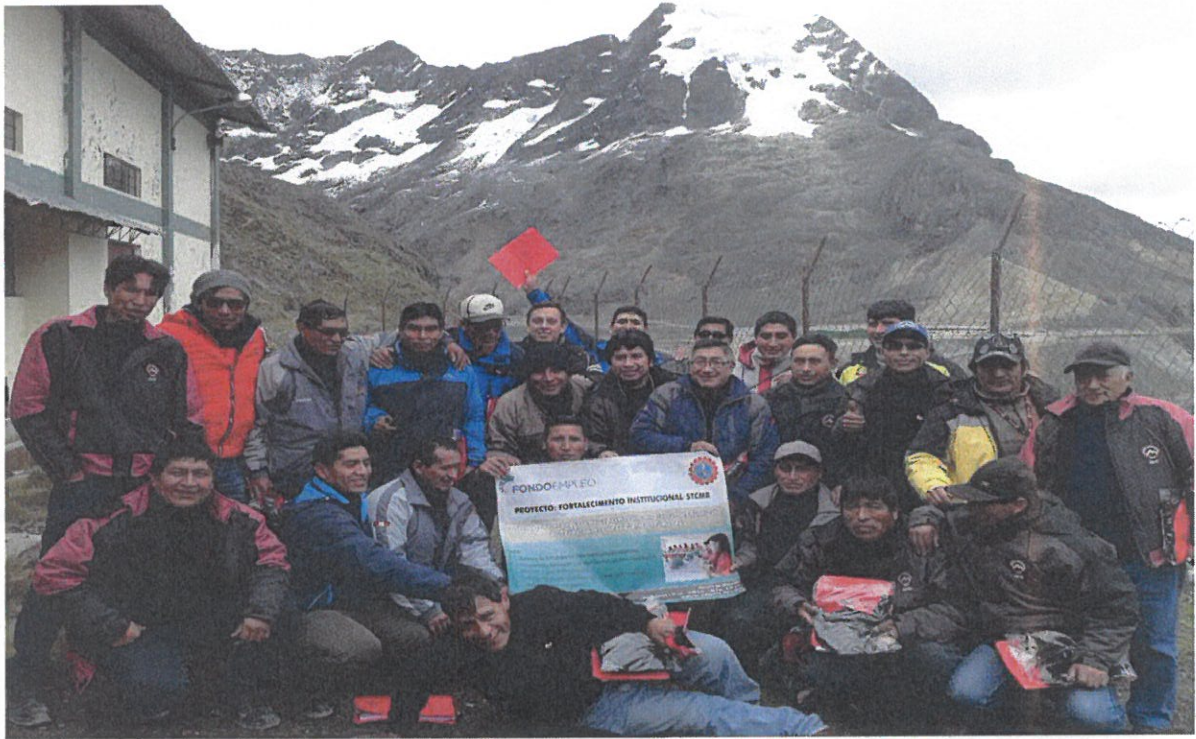
Foto 7: Agremiados del Sindicato luego de participar del curso de Habilidades Blandas y Dirigenciales