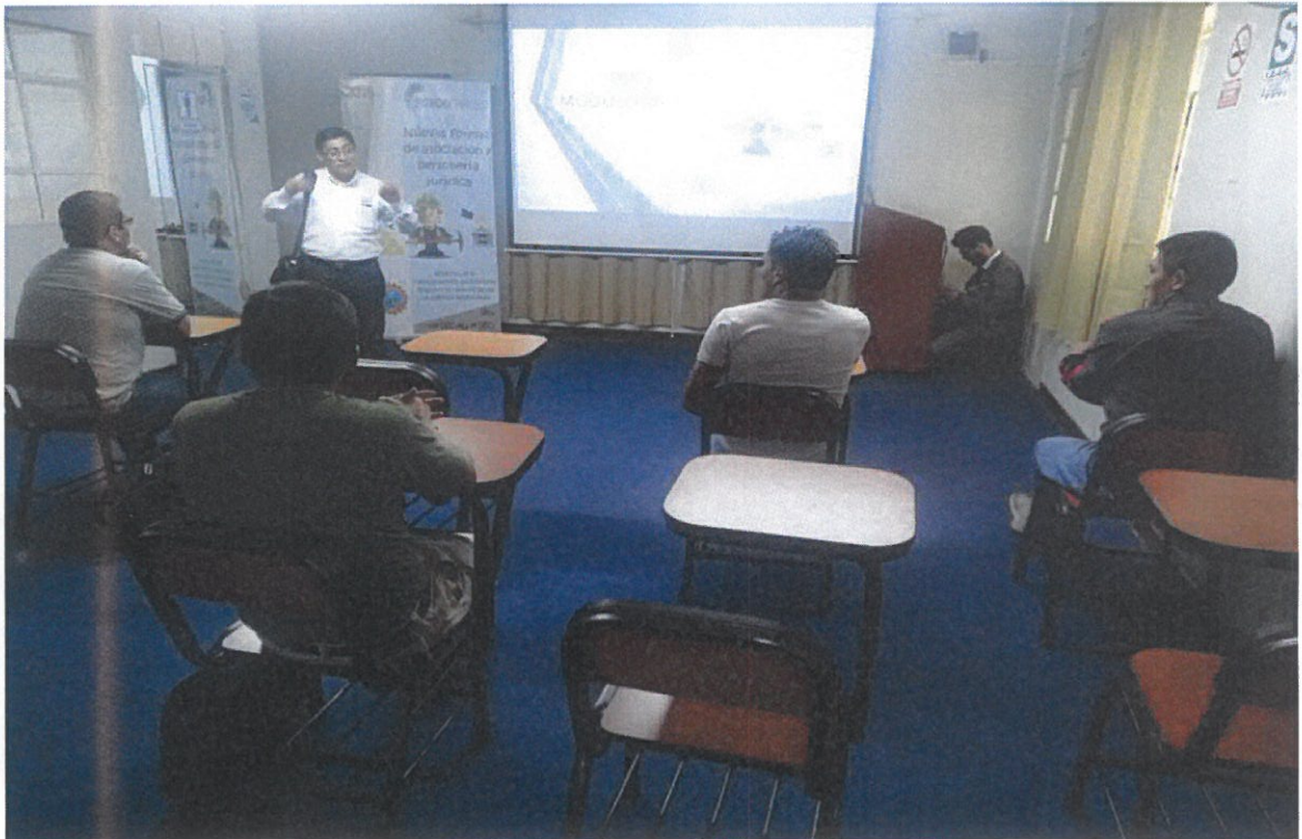
Foto 2: Visita de supervisión al curso de capacitación Nuevas Formas de Asociación y Personería Jurídica