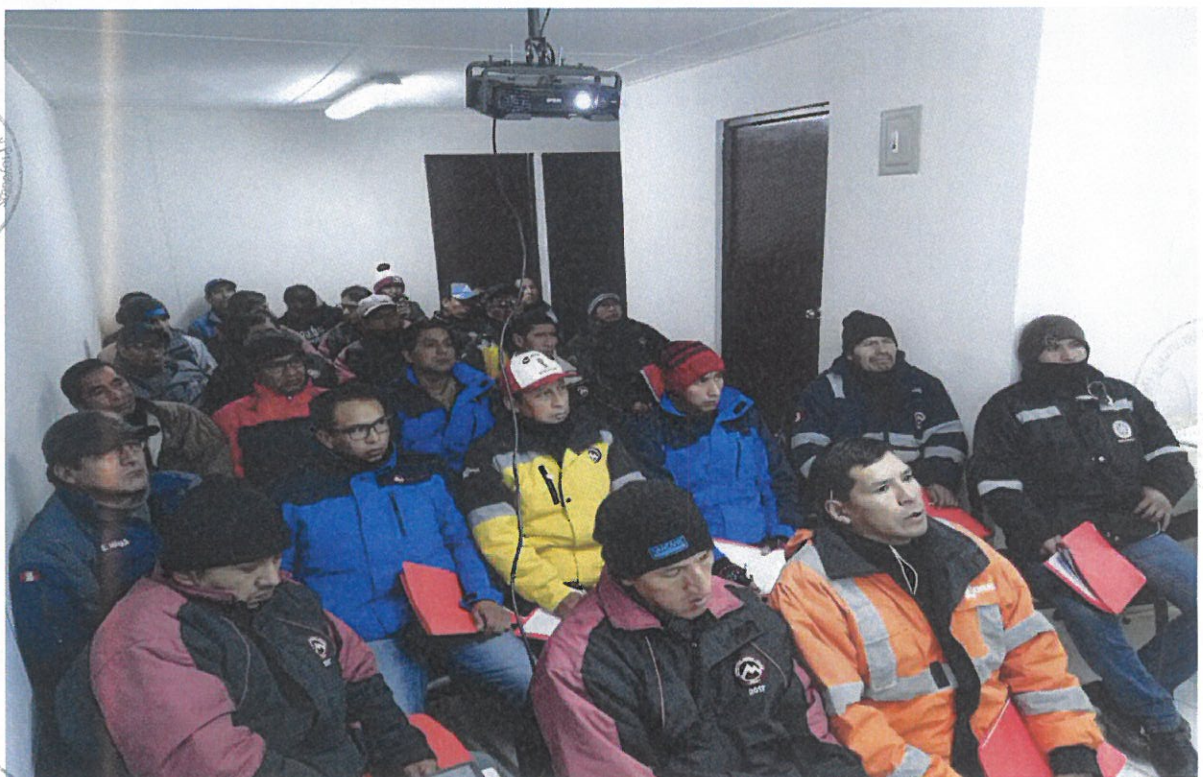
Fotos 6: Agremiados organizados por turnos participan de la capacitación Negociación Colectiva